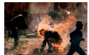
Miksi Afrikka ei menesty?

Järgnev näitab, millise saatusliku vea teevad need, kes eeldavad neegritelt samasugust intelligentsi, kui see on valgetel või kollastel, kirjutajaks mees, kes on elanud ja õpetanud 20+ aastat Aafrikas: "Miksi Afrikka ei menesty?"