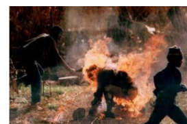
Miksi Aafrika ei menesty?

Järgnev näitab, millise saatusliku vea teevad need, kes eeldavad neegritelt samasugust intelligentsi, kui see on valgetel või kollastel, kirjutajaks mees, kes on elanud ja õpetanud 20+ aastat Aafrikas: